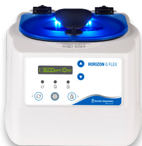
HORIZON 6 Flex

Unschlagbare Qualität für jeden Haushaltsplan. Jede HORIZON-Zentrifuge ist einsatzbereit mit einem horizontalen Rotor, Universal-Röhrchenhaltern und einer 2-Jahres-Gewährleistung zum günstigen Preis.