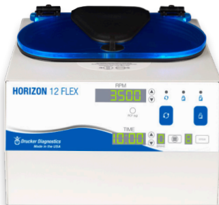
HORIZON 12 Flex