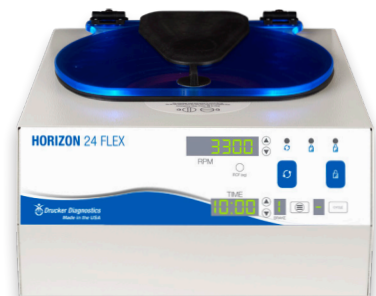
HORIZON 24 Flex

In den USA entwickelt und hergestellt. US-Support.